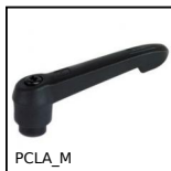
Maniglia a ripresa - femmina, Plastica