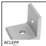
Angolare, 2 fori