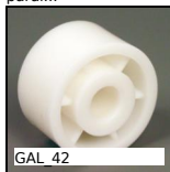
GAL 42 Rullo per trasportatore, Senza cuscinetti a sfere