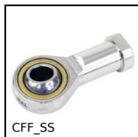
Testa a snodo femmina DIN ISO12240-4, Inox / bronzo - Serie