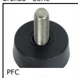
Piede fisso, Livellamento per piccoli elementi