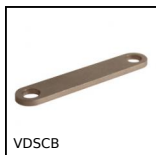
Bloccaggio scorrevole per la regolazione, Piastrini di base per il blo...