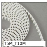
Cinghia aperta al metro tipo T, T10 Poliuretano armatura in acciaio