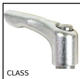
Maniglia a ripresa - femmina, Inox