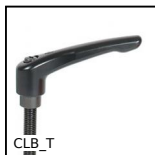
Maniglia a ripresa, Zamak