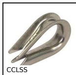
Capocorda ad occhiello, Inox