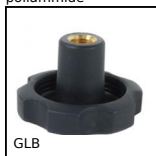
GLB Volantino a 6 lobi, Tecnopolimero - Ottone