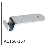
AC156-157 Riscontro per chiusura a leva rigida ad anello, 25,5mm