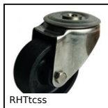
Ruota alte temperature con foro centrale, fino a 200kg