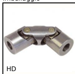
Giunto cardanico doppio ad aghi, Sollecitazioni intense