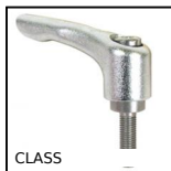
Maniglia a ripresa - maschio, Inox