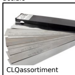
Cuscinetti a sfere - Accessorio, Spessori metallici centesimali