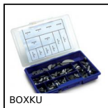
Box kit di chiavette a disco, Box kit di chiavette a disco - acciaio