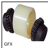
GFX Giunto a dentatura bombata serie economica, Acciaio e poliammide