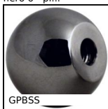
GPBSS Impugnatura sferica femmina filettata, Alluminio