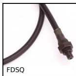
FDSQ Flexible drive shaft, Masterflex® Steel, with PVC casing