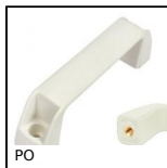
PO Maniglia a ponte - Multi-settore, Foro cieco maschiato