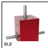
BL8 Rinvio angolare, da 0.20 a 2 Nm