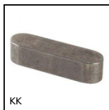
KK Chiavetta rettangolare, Acciaio