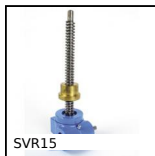
SVR15 Martinetto a vite - Vite rotante, Con madrevite esterna