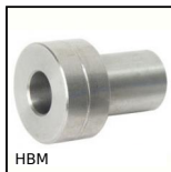
HBM Guida su semi-binari, Boccola di regolazione