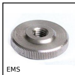
EMS Volantino zigrinato, Zigrinato