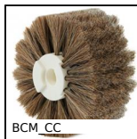
BCM_CC Spazzola cilindrica modulare, Filo di crine di cavallo