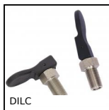
DILC Indexing plunger with cam, with cam