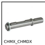
CHMX_CHMDX Albero per riduttore a ruota e vite senza fine CHMR e CHM, Albero se...