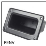
PENV Maniglia da incasso, Ad avvitare