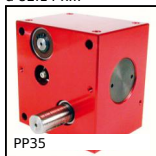
PP35 Riduttore a ruota e vite senza fine, da 2.20 a 4.10 Nm