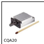
CQA20 Slitta di regolazione miniatura, 20