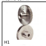
H1 Ingranaggio elicoidale ad assi incrociati a 90°, Acciaio 20NCD2