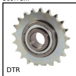
DTR Pignone tendicatena, Ruota dentata in acciaio