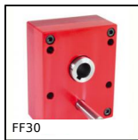
FF30 Riduttore ad alberi paralleli, da 21.50 a 83 Nm