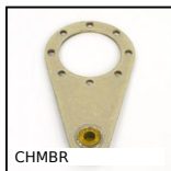
CHMR Braccio di reazione, Braccio di reazione per riduttori CHM e CHMR