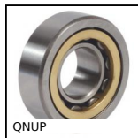
QNUP Cuscinetto a singola corona di rulli cilindrici, Anello interno con ...