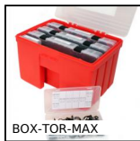
BOX-TOR-MAX Valigetta di guarnizioni toriche in nitrile, 2.90 x 1.78mm a 82.14 x...