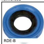
RDE-B Rondella di tenuta Hygienic Usit®,