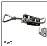
SVG Chiusura a leva regolabile, Corsa da 106,7mm a 121,4mm