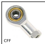
CFF Testa a snodo femmina DIN ISO12240-4, Acciaio / bronzo