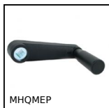
MHQMEP Manovella ad impugnatura girevole,