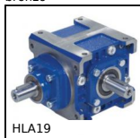
HLA19 Rinvio angolare a dentatura spiroidale, Fino a 43Nm