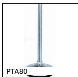
PTA80 Piede snodato con base stampata Ø80, Ø