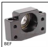
BEF Vite a ricircolo di sfere miniatura, Supporto con cuscinetto