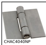
CHAC4040NP Cerniera, Quadrata con rivetto senza fori