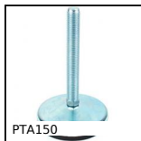
PTA150 Piede snodato con base stampata Ø150, Ø 150