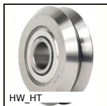
HW_HT Guida su semi-binari, Ruota