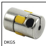
DKGS Giunto senza gioco Gerwah®, da 0.5 a 3Nm