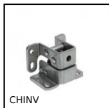
CHINV Cerniera invisibile, Invisibile - Apertura fino a 90°