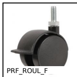
PRF_ROUL_F Ruota per profili alluminio, Con freno