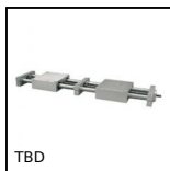
TBD Tavola di posizionamento a passo inverso manuale, 20kg