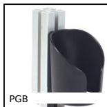
PGB Attrezzi, Porta attrezzi