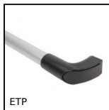
ETP Maniglia e battuta per porta, Modulare