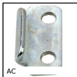
AC Piastrina di riscontro, 13mm