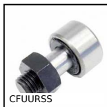
CFUURSS Perno folle inox, Standard - inox