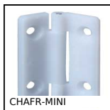
CHAFR-MINI Cerniera, A frizione