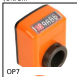
OP7 Indicatore di posizione digitale (N. di giri), 5 cifre