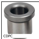
CDPC Boccola di posizionamento, Acciaio