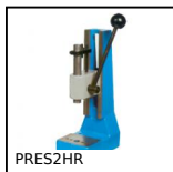
PRES2HR Pressa manuale da banco, Pressione fino a 200kg