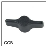
GGB Dado ad alette, Cieco