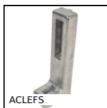
ACLEFS Elementi di ancoraggio, Standard