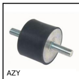
AZY Antivibrante elastico cilindrico, Acciaio