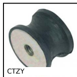
CTZY Antivibrante elastico sgolato, Acciaio