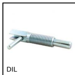
DIL Pistoncino a molla, a leva