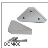
DOMI80 Kit di raccordo, Kit di raccordo XZ