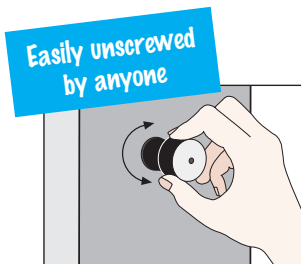
Same tightening torque