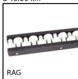
RAG Guida di scorrimento a rullini,