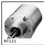
NT121 Riduttore coassiale a treni paralleli, da 20 a 68 Nm - a treni paral...