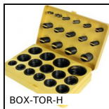
BOX-TOR-H Valigetta di guarnizioni toriche in nitrile, 3.00 x 2.00mm a 45.20 x...