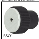
BSCf Manopola, Con coppia regolabile