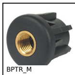
BPTR_M Tappo per tubo, Con inserto maschiato