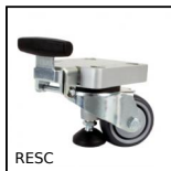
RESC Ruote con supporto di livellamento, Ruote con supporto di livellamento