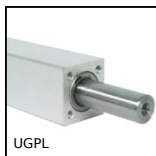
UGPL Unità di guida per cilindrico, Cuscinetto