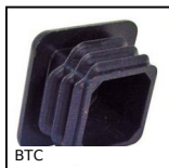
BTC Tappo per tubo quadrato, Standard