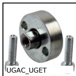
UGAC_UGET Guida per cilindrico, Ghiera per stelo filettato del martinetto