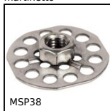
MSP38 Inserto con piastrina a incollare Masterplate®, Cilindrico Ø38 con...