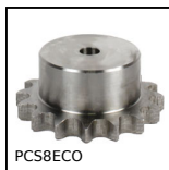
PCS8ECO Pignone a catena - acciaio, 8mm (DIN