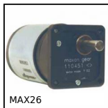
MAX26 Motoriduttore DC 12V e 24V DC, da 0,075 a 0,6Nm