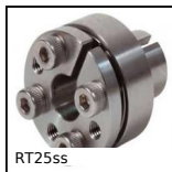
RT25ss Self-centering flanged locking assembly, Coppia media/elevata