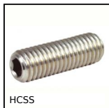
HCCS Grano con punta a coppa, punta a coppa