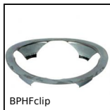
BPHfclip Sfera portante, Anello di fissaggio - montaggio dall'alto