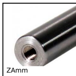
ZAm Albero per guida lineare, Acciaio temprato