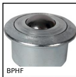
Sfera portante a incastro con flangia, Forte