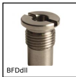
Boccola di fermo per perno ad innesto, Acciaio nichelato