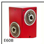
Riduttore a rinvio angolare, da 4.50 a 24 Nm