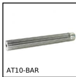
Barra dentata, AT10