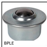
Sfera portante a incastro, Leggero