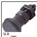
Pistoncino a molla, acciaio classe 5.8