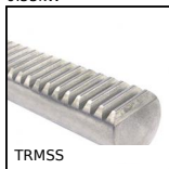
Cremagliera a sezione circolare, Inox - modulo 1-5