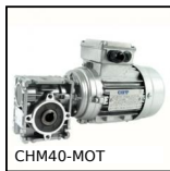
Motoriduttore AC asincrono da 0,18 a 0,55kW, 0.18 a 0.55kW