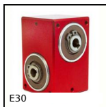
Riduttore a rinvio angolare, da 1.50 a 9 Nm