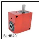
Rinvio angolare ad albero cavo, fino a 10.3 Nm