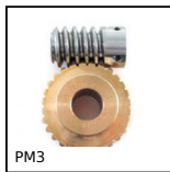
PM3 Coppia ruota e vite senza fine, Bronzo