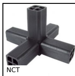
NCT Giunto di collegamento, Ad angolo fisso