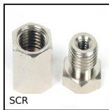
SCR Accessori per ventosa, Adattatore per inserto