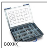
BOXKK Box kit di chiavette, Box kit - Acciaio o inox