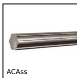
ACAss Albero scanalato Inox 304, Inox