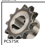
PCS75K Pignone a catena dentatura temprata,