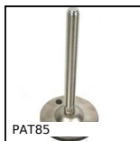
PAT85 Piede snodato con base stampata Ø85, Ø