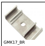
GMK17_BR Morsetto porta guide, Conico doppio