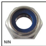
NIN Dado autofrenante, Inox A2