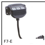
F7-E Visualizzatore multifunzione, Con sensore di posizione esterno