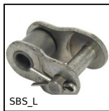
SBS_L Giunzione per catena al metro, Falsa maglia - inox