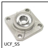
UCF_SS Cuscinetto a flangia quadrata tutto inox, inox