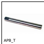
APB_T Perno di fissaggio per morsetti, Maschiato