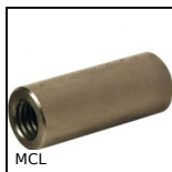
MCL Manicotto di riduzione, Cilindrico - acciaio