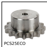
PCS25ECO Pignone a catena - acciaio, 6.35mm