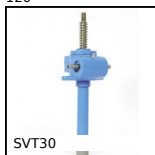
SVT30 Martinetto a vite - Vite traslante, Vite traslante