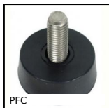
PFC Piede fisso, Livellamento per piccoli elementi