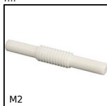
M2 Vite senza fine, Plastica lavorata (delrin)