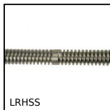
LRHSS Vite trapezoidale a doppia inclinazione, a doppia inclinazione - 1 f...