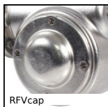
RFVcap Coperchio di protezione inox, Coperchio di protezione chiuso