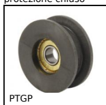
PTGP Puleggia folle, Per cinghia piatta