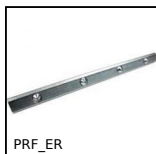
PRF_ER Elementi di giunzione, Elemento di raccordo