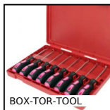
BOX-TOR-TOOL Valigetta di guarnizioni toriche in nitrile, Extraction tools