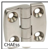
CHAEss Cerniera estetica, Inox