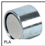
PLA Magnete piatto, Magnete piatto