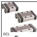
GCL Guida lineare a sfere - Sfere inox, Carello -