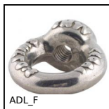
ADL_F Anello di sollevamento, Inox