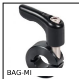
BAG-MI Anello di serraggio con intaglio e maniglia a leva, Acciaio