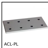
ACL-PL Elementi di giunzione, Piastra di fissaggio -