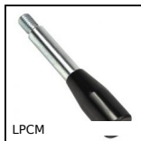
LPCM Leva con impugnatura cilindrica, Duroplast nero, leva in acciaio