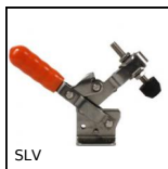
SLV Attrezzo di bloccaggio a leva verticale, A leva verticale - inox