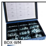
BOX-WM Rondella semplice - DIN125, Valigetta di rondelle acciaio