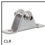
CLR Staffa di montaggio per molla a gas, Staffa di montaggio per forcell...