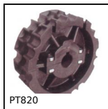
PT820 Pignone di trazione, Serie 820 e 815