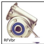
RFVbr Riduttore inox a ruota e vite senza fine, Braccio di reazione