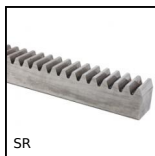
SR Cremagliera sezione stretta, Inox