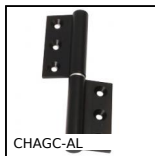
CHAGC-AL Cerniera ad avvitare, Sfilabile