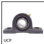
UCP Cuscinetto ritto in ghisa, Ghisa