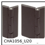
CHA1056_U20 Cerniera ad avvitare, Sezione 90X60