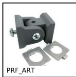
PRF_ART Cerniere e giunti, Standard