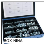
BOX-NINA Dado autofrenante - DIN985, Valigetta di dadi acciaio