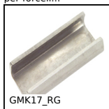
GMK17_RG Morsetto di giunzione, Per guida prodotto laterale