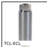
TCL-ECL Piede massiccio per carichi pesanti, Vite a registro