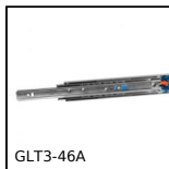
GLT3-46A Guide telescopiche acciaio con ammortizzatore, Estensione totale