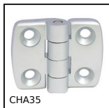
CHA35 Cerniera ad avvitare, Hinge