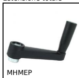
MHMEP Manovella ad impugnatura girevole, Prealesata