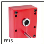
FF15 Riduttore ad alberi paralleli, da 2.20 a 10 Nm