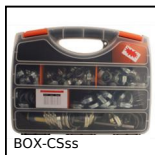
BOX-CSss Fascette di serraggio, Valigetta di fascette inox