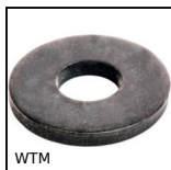
WTM Rondella per serraggio - DIN6340, Acciaio