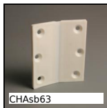
CHAsb63 Cerniera senza perno, Cerniera in polimero