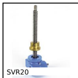
SVR20 Martinetto a vite - Vite rotante, Con madrevite esterna