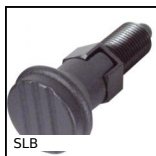
SLB Pistoncino a molla, acciaio classe 5.8