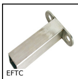
EFTC Supporto di fissaggio, Inox