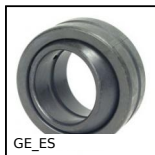
GE_ES Snodo sferico, acciaio/acciaio