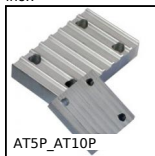
AT5P_AT10P Piastra di giunzione per cinghia AT, AT5