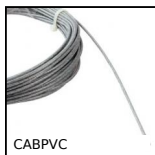
CABPVC Cavo acciaio galvanizzato con PVC trasparente, Acciaio galvanizzato ...