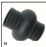
M Manicotto per giunto cardanico, Accessori