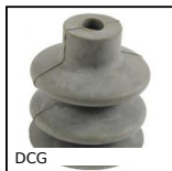
DCG Ventosa, Gomma naturale