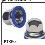
PTKFss Piede speciale agroalimentare, Dado