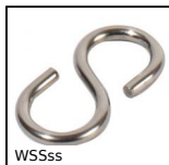
WSSss Gancio a S simmetrica, Inox