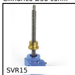
SVR15 Martinetto a vite - Vite rotante, Con madrevite esterna