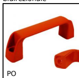
PO Maniglia a ponte - Multi-settore, Foro liscio