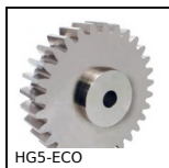
HG5-ECO Ingranaggio dritto acciaio - serie ECO, Acciaio C45