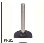
PR85 Piede fissabile con snodo - poliammide, Ø 83