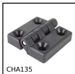
CHA135 Cerniera ad avvitare, 135 gradi