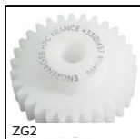
ZG2 Ingranaggio dritto in plastica, Plastica lavorata (delrin)