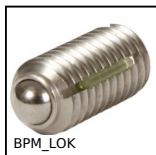
BPM_LOK Pressore a molla con intaglio e puntale a sfera, LONG-LOK - Inox 303