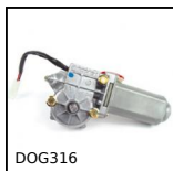
DOG316 Motoriduttore DC 12V e 24V DC, da 1.5 a 2 Nm