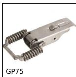
GP75 Chiusura a leva molla a trazione compensata, Standard (GP75)