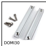
DOMI30 Accessori di collegamento, Kit di fissaggio