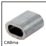
CABma Manicotto ovale per cavo, Per la crimpatura di un cavo in acciaio