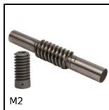
M2 Coppia ruota e vite senza fine, Acciaio temprato