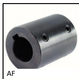
AF Giunto rigido con cava chiavetta, Set screw