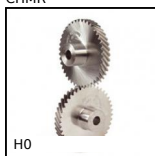
H0 Ingranaggio elicoidale ad assi incrociati a 90°, Acciaio 20NCD2