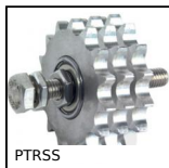
PTRSS Pignone tendicatenena, Per ambienti aggressivi