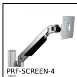
PRF-SCREEN-4 Screen support, Support with 4 axes of rotation