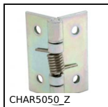
CHAR5050_Z Cerniera a molla, avvitabile