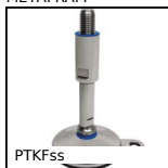
PTKFss Piede fissabile speciale agroalimentare,