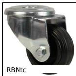
RBntc Ruota girevole a foro centrale, Acciaio - caucciù