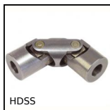
HDSS Giunto cardanico - inox, Sollecitazioni intense