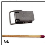
GE Chiusura a leva, Miniature