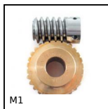
M1 Coppia ruota e vite senza fine , Bronzo