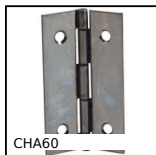
CHA60 Cerniera, Rettangolare forata o con fori svasati