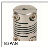
B3PAN Panamech, Multi- Beam inox, Inox - con ganascia di serraggio