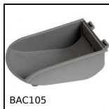
BAC105 Contenitore a becco, 8mm