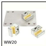
WW20 Carrello Drylin® W, Carrello