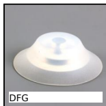
DFG Ventosa, silicone