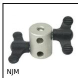
NJM Connettore rinvio d'angolo, Multiplo