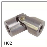
H02 Giunto cardanico semplice ad aghi, Sollecitazioni intense