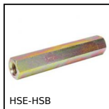
HSE-HSB Distanziatore esagonale, Acciaio