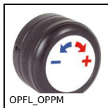
Accessorio per indicatori, Pomello di manovra