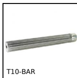
Barra dentata, T10