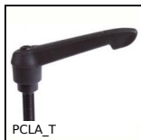
Maniglia a ripresa, Plastica