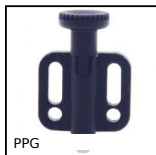
PPG Pistoncino a molla, Con flangia di fissaggio orizzontale