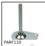
PARF110 Piede senza snodo, Piede snodato