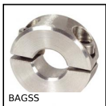
Anello di bloccaggio inox, Inox