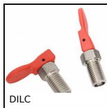
DILC Indexing plunger with cam, with cam