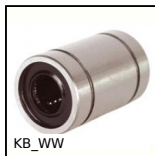
KB_WW Manicotto chiuso a sfere di precisione, Economica