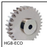
Ingranaggio dritto acciaio, Acciaio C45