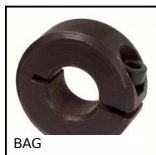
Anello di bloccaggio in acciaio, Acciaio