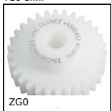
Ingranaggio dritto in plastica, Plastica lavorata (delrin)