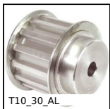
Puleggia dentata di posizionamento tipo T, Serie economica - T10 all...