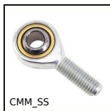
Testa a snodo maschio DIN