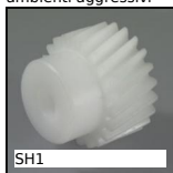
Ingranaggio elicoidale ad assi paralleli,