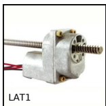
Attuatore lineare a motore, 1 ampere