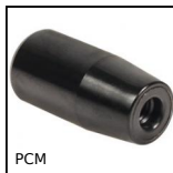
PCM Impugnatura cilindrica fissa, Impugnatura non girevole