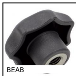
Manopola, stella, anti- bacterial