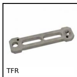
TFR Tenditore rigido, Fisso