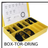
BOX-TOR-DRING Valigetta di guarnizioni toriche in acciaio