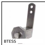
Tenditore automatico universale per tenditore, Per ambienti aggressivi