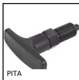
PITA Pistoncino a molla, con maniglia a T