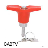
BABTV Ball lock pins lockable, Stainless steel