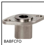
BABFCFO Perno autobloccante, Boccole di fissaggio con flangia ovale