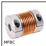
MFBC Giunto a soffietto, Alluminio e bronzo - con ganaschia di serraggio