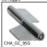
CHA_GC_9SS Cerniera a bandiera inox, A saldare