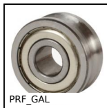
PRF_GAL Rotella per profilo alluminio, Rotella cava Ø12