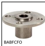
BABFCFO Perno autobloccante, Boccole di fissaggio con flangia cilindrica