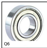
Q6 Cuscinetto radiale a sfere, Acciaio