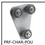
PRF-CHAR-POU Attrezzi, Carrello attrezzi