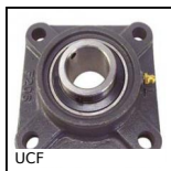
UCF Cuscinetto a flangia quadrata in ghisa,