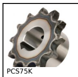
PCS75K Pignone a catena dentatura temprata,