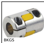
BKGS Giunto senza gioco Gerwah®, da 1.2 a 450Nm