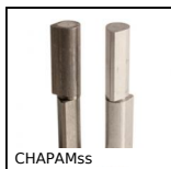
CHAPAMss Cerniera a testa piatta a saldare, Inox o Alluminio