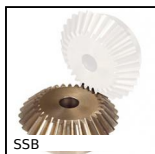
SSB Ingranaggio conico inox, 1:1