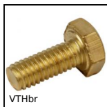
VTHbr Vite a testa esagonale - DIN933, Ottone