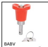
BABV Ball lock pins lockable , Stainless steel