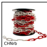
CHNrb Catena segnaletica rossa e bianca,