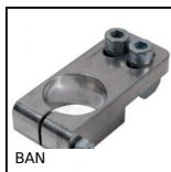
BAN Connettore / supporto per profili alluminio, Universale