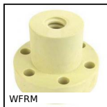
WFRM Dado trapezoidale, Polimero (Iglidur®) - 1 filetto