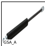
GSA_A Molla a gas regolabile, Acciaio