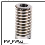
PW_PWG3 Vite senza fine di precisione, Acciaio