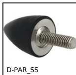
D-PAR_SS Piedino antivibrante parabolico, inox