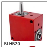
BLHB20 Rinvio angolare ad albero cavo, fino a 1.77 Nm