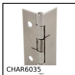
CHAR6035 Cerniera a molla, avvitabile e saldabile