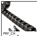
PRF_CH Catena porta cavo, Supplied in metre lengths