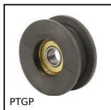
PTGP Puleggia folle, Per cinghia piatta