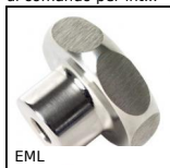
EML Volantino a lobi, Dado monoblocco