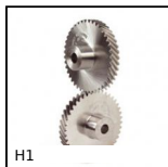
H1 Ingranaggio elicoidale ad assi incrociati a 90°, Acciaio 20NCD2