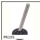
PR105 Piede fissabile con snodo - poliammide, Ø 103