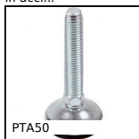
PTA50 Piede snodato con base stampata Ø50, Ø