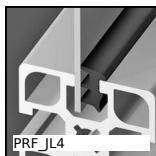
PRF_JL4 Panel accessories, Guarnizione - Ø 4mm