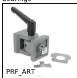
PRF_ART Cerniere e giunti, Con maniglia di serraggio