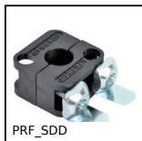
PRF_SDD Supporto per sensore Ø12, Ø12