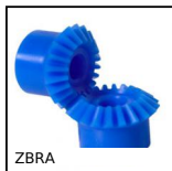
ZBRA Ingranaggio conico in plastica, 1:1