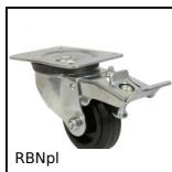
RBNpl Ruota girevole a doppio bloccaggio,