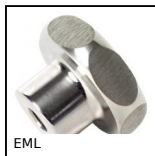
Volantino a lobi, Dado monoblocco