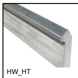
Guida su semi-binari, Binario