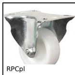
Ruota fissa con piastra, Acciaio - Poliammide