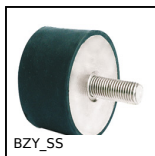
Antivibrante elastico cilindrico inox, Inox