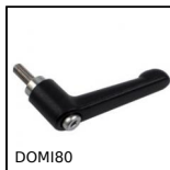
Accessori di collegamento, Leva di serraggio