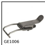
Chiusura a leva adattabile, Per aggancio in gola