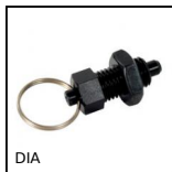
Pistoncino a molla, con anello