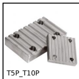
Piastra di giunzione per cinghia T, T10