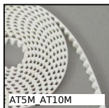
Cinghia aperta al metro tipo AT, AT10 Poliuretano armatura in acciaio