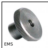
EMS Volantino zigrinato, Zigrinato