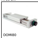
DOMI80 Slitta di regolazione Domino 80, Slitta