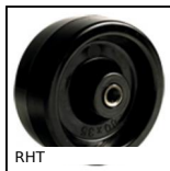
RHT Ruota alte temperature, fino a 200kg