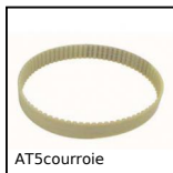
AT5courroie Cinghia chiusa posizionamento AT, AT5 Poliuretano armatura in acciaio