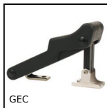
GEC Chiusura a leva in gomma con aggancio, Bloccabile