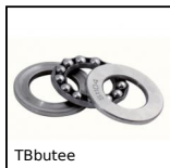
TBbutee Cuscinetto assiale a sfere a semplice effetto, Sfere acciaio