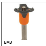
BAB Perno autobloccante a sfere, Inox temprato