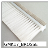
GMK17_BROSSE Spazzola, Per imbottigliamento e imballaggio