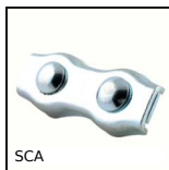
SCA Serracavo, Acciaio