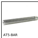
AT5-BAR Barra dentata, AT5