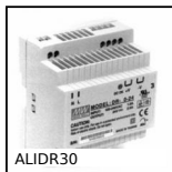
ALDR30 Alimentazione, 1,5 A and 2 A