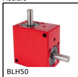
BLH50 Rinvio angolare a L, da 7.70 a 20 Nm