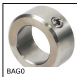
BAG5 Anello di bloccaggio, Inox