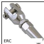
ERC Terminale rapido per cavi, A forcella