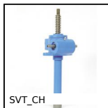
SVT_CH Martinetto a vite - Montaggio con terminale forato, Console girevole