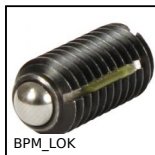
BPM_LOK Pressore a molla con intaglio e puntale a sfera, LONG-LOK - Acciaio