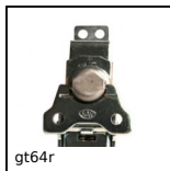
gt64r Chiusura a farfalla molla, Tolleranze di montaggio ampie