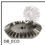
DB_ECO Ingranaggio conico - Acciaio C43 - ECO, 2:1