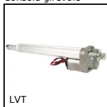
LVT Mini martinetto motorizzato 1A, 1 ampere