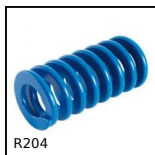
R204 Molla per stampi ISO10243, Medio