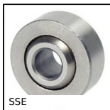
SSE Snodo sferico inox, Inox/PTFE