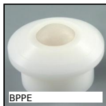
BPPE Sfera portante, Leggero