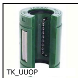
TK_UUOP Manicotto a sfere autoallineante