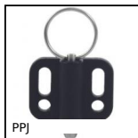
PPJ Pistoncino a molla, Con flangia di fissaggio orizzontale