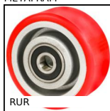
Ruota, Poliuretano - Mozzo alluminio (Ultra scorrevole)