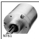
Riduttore coassiale a treni paralleli, da 5 a 14 Nm - a treni parall...