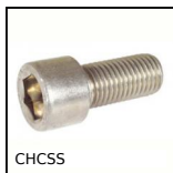
Vite a testa cava esagonale CHC, Inox - A2