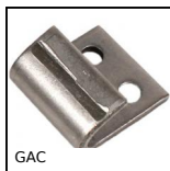
Chiusura a leva con serratura, Riscontro grezzo