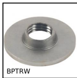
Piastra inox a saldare tonda, A saldare