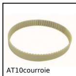
Cinghia di posizionamento AT, AT10 Poliuretano armatura in acciaio