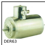
Motore inox AC asincrono 0,18kW, 0.18kW