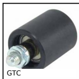
Rullo tendicinghia, Per applicazioni correnti