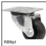
Ruota girevole con piastra, Acciaio - caucciù