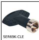
Chiusura 1/4 di giro per agroalimentare, Chiave