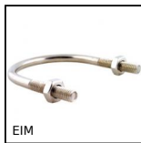
Cavallotto Inox, Inox