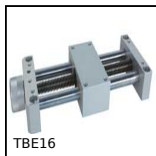
TBE16 Economic mini-table with trapezoidal leadscrew, 5kg