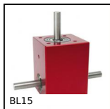
BL15 Rinvio angolare, da 1.10 a 6 Nm