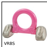
VRBS Anello di sollevamento, Articolato - a saldare