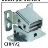
CHINV2 Cerniera invisibile, Invisibile - Apertura fino a 125°