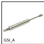
GSI_A Molla a gas regolabile in inox, Inox