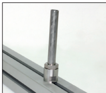
Esempio di applicazione