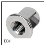
EBH Dado cieco Hygienic Design®, Con collare