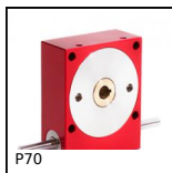
P70 Riduttore a ruota e vite senza fine, fino a 2000 rpm