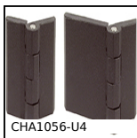
Cerniera ad avvitare, Aperura 180°