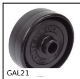
Ruota per trasportatore, Plastica