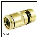
Limitatore di coppia ad attrito Vari-Tork®, 0.53 a 1.32 Nm