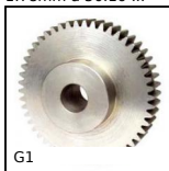
Ingranaggio dritto acciaio, Acciaio 20NCD2