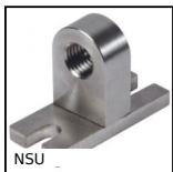
Supporto per sensore, Morsetto universale base a 90°