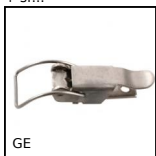
Chiusura a leva, Standard