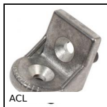
Angolare, Angolare orientabile