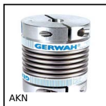
Giunto a soffietto Gerwah®, da 22 a 180Nm