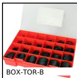
Valigetta di guarnizioni toriche in nitrile, 20.38 x 1.78mm a 50.16 ...