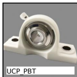
Cuscinetto ritto polimero inox, polimero e inox