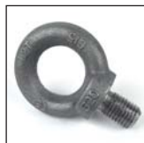
Anello di sollevamento acciaio