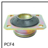
PCF4 Supporto antivibrante cabina conico, Piastra a base quadrata