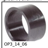
OP3_14_06 Accessorio per indicatori, Boccola di riduzione