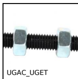
UGAC_UGET Guida per cilindrico, Giunto per stelo filettato del