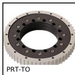
PRT-TO Corona girevole Iglidur®, Con dentatura esterna-Iglidur®, allumini...