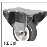
RBGpl Ruota fissa con piastra, Acciaio - gomma grigia