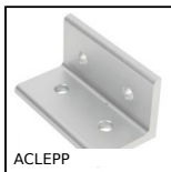
ACLEPP Angolare, 4 fori