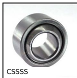
CSSSS Snodo sferico inox, Inox/ PTFE