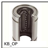
KB_OP Manicotto a sfere di precisione, Di precisione - acciaio