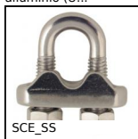
SCE_SS Serracavo, Inox