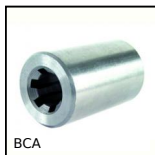
BCA Ghiera scanalata cilindrica in acciaio, Acciaio