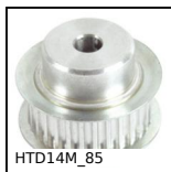
HTD14M_85 Puleggia dentata di trasmissione tipo