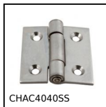
CHAC4040SS Cerniera, Quadrata con rivetto e fori