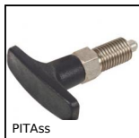
PITAss Pistoncino a molla, con maniglia a T