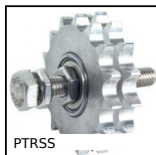
PTRSS Pignone tendicatena, Per ambienti aggressivi