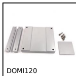
DOMI120 Accessori di collegamento, Piastra