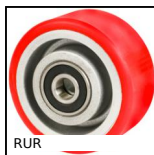
RUR Ruota, Poliuretano - Mozzo alluminio (Ultra scorrevole)