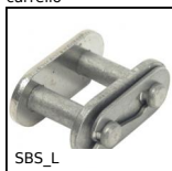
SBS_L Giunzione per catena al metro, Maglia di giunzione - inox