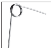
TO-R Molla avvolgimento a destra (standard)