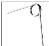
TO-L Molla avvolgimento a sinistra (opzione)