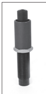
Esempio di utilizzo